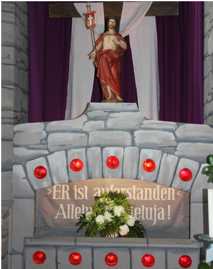
Heiliges Grab in der Stadtpfarrkirche

ST. NIKOLAUS UND STEPHAN EGGENFELDEN ST. MICHAEL KIRCHBERG